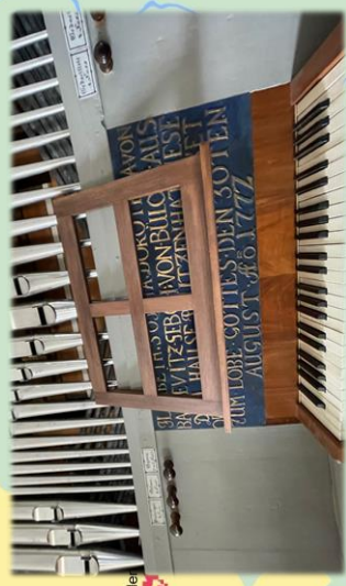
Kirche Hohen Luckow